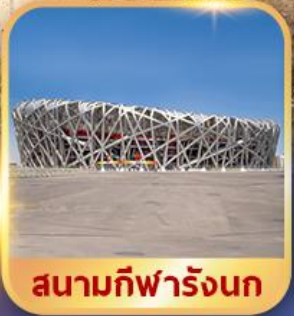
สนามกีฬารังนก