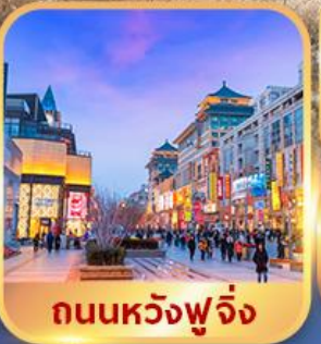
ถนนหวงฟู่จิ่ง