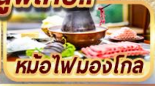
หม้อไฟมองโกล