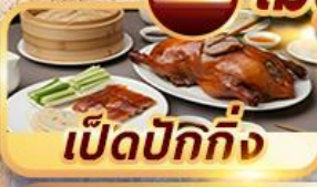
เป็ดปักกิ่ง