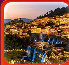
"เมืองโบราณฟูหลงเจิน"