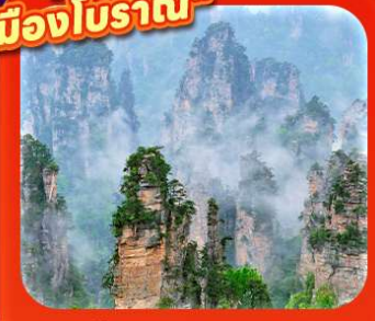
"หุบเขาอวตาร"