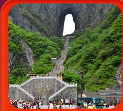
"กำแพงประตูสวรรค์"