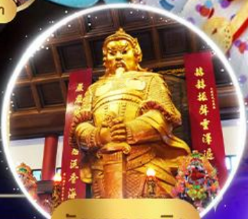
วัดแซกงหมิว