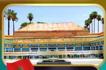
พระราชวังบาเอีย