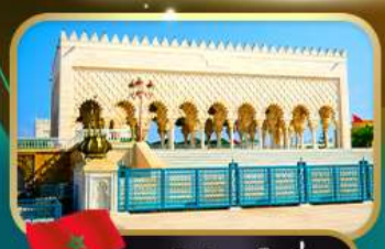
สุสานโมอัมเหม็ดที่ 5