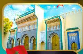
ประตูพระราชวังหลวง