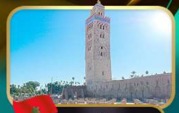
มัสยิดคูตูเบีย มาราเกช

หมู่บ้านเซฟซาอุน • หอคอยอัลซัน • ป้อมอูดายาส • สุเหร่าไครเวิน • สุสานมูเลย์ อีสมายิล • จัตุรัสจามาเอลฟา • อัฒนาฮัดดู • ป้อมทากูริก • ย่านฮูบัส • จัตุรัสโมอัมเหม็ดที่ 5