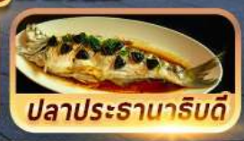
ปลาประดานาธิบดี