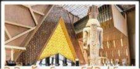
พิพิธภัณฑ์แกรนด์อียิปต์(GEM)

อารยธรรมลุ่มแม่น้ำไนล์ - พีรามิด - อเล็กซานเดรีย - เมมฟิส - ไคโร - โรงแรมระดับ 4 ดาว รวมค่าวีซ่า ตะลุยกะเลทราย - อาหารครบทุกมื้อ