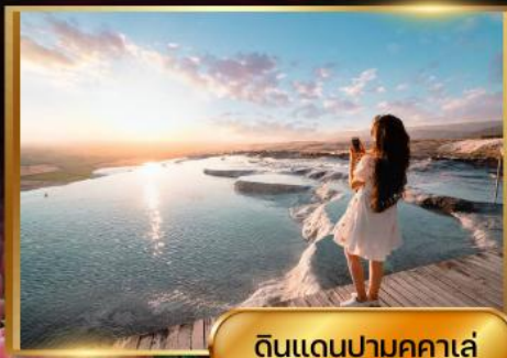
ดินแดนปามุคคาเล่