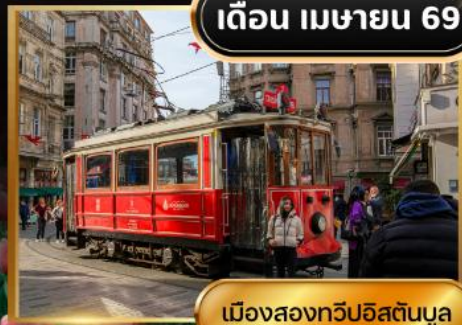
เมืองสองทวีปอิสตันบูล