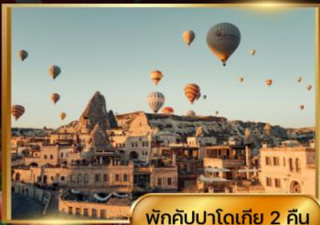
พักคิปปาโดเกีย 2 คืน