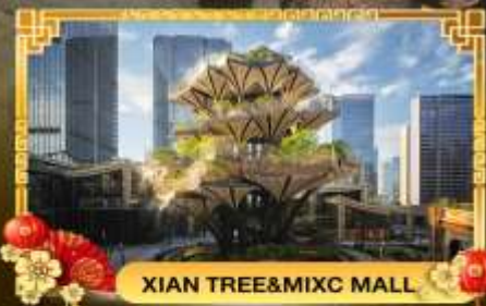
XIAN TREE&MIXC MALL