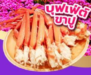
บุฟเฟ่ต์ ขาปู