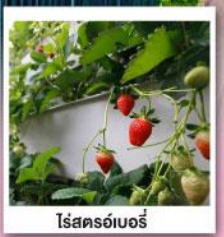
โรสครอ์เบอร์รี่