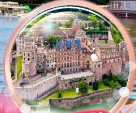
ปราสาทไฮเดิลเบิร์ก