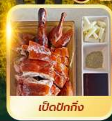
เปิดปอกกิ้ง