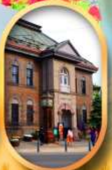
พิพิธภัณฑ์กล่องดนตรี