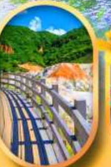
โนโบริเบทสึ