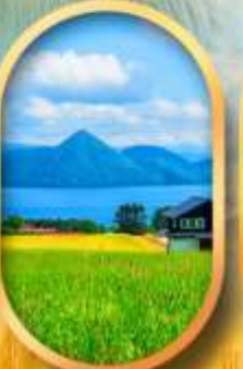
ทะเลสาบโทโยะ