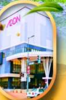
อออนมอลล์