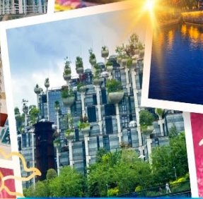
Tian An 1000 Trees