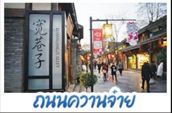
ถนนควานจ้าย