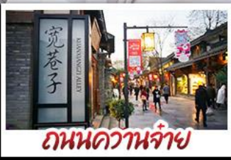
ถนนความจำ