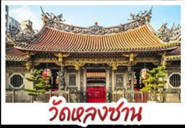
วัดเจหลงซาน