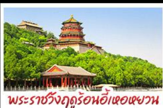
พระราชวังฤดูร้อนอี๋เหอหยวน

กำแพงเมืองจีนด่านจวิรงกวน - พระราชวังฤดูร้อนอี๋เหอหยวน สวนจิ่งอัน - วัดลามะ - ไหม่หลงร้านช้อปปิ้ง - โรงแรม 4 ดาว มื้อพิเศษ เปิดปิกนิก สุกี่มองโก MICHELIN GUIDE ร้าน TAO TAO JU