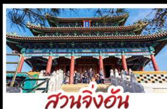
สวนจิ่งอัน