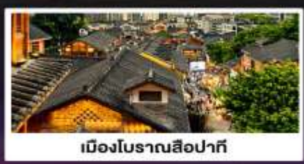
เมืองโบราณสือปาตี