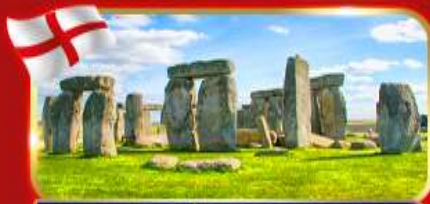
สโตนเฮนจ์ สิ่งมหัศจรรย์ของโลก