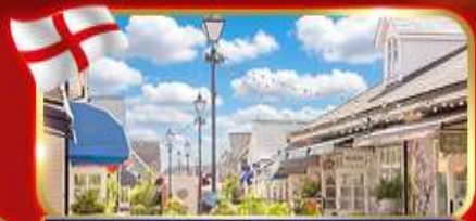
ช้อปปิ้งเอาร์ทีล Bicester village