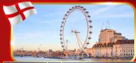
ชมวิวชิงช้าที่สูงที่สุดในยุโรป ลอนดอนอาย