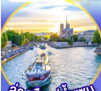
ล่องเรือแม่น้ำแชน