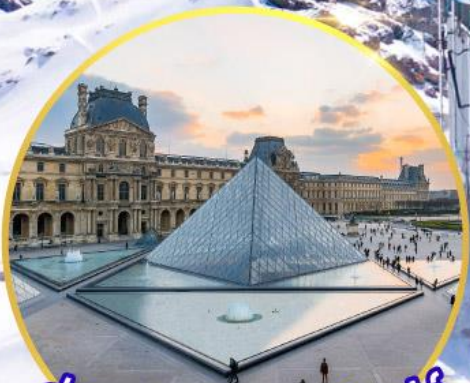
ถ่ายรูปพิพิธภัณฑ์ลูฟร์