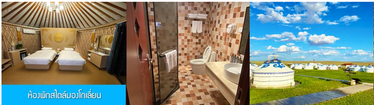
ห้องพักสไตล์มองโกลเลียน