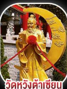
วัดหวังต้าเซียงเน

พระใหญ่ลันเตา+กระเช้าองปีง 360 วัดเจ้าแม่กวนอิมรีพลัสเบง์ - องค้เซก วัดกวนไท(เทพเจ้ากวนอู) - วัดเจ้าแม่กวนอิมฮ่งฮ่า วัดหวังต้าเซียงเน - วัดบิกไค