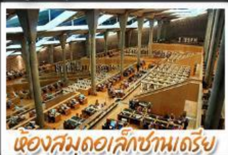
เขื่องสมุดอเล็กซานเดรีย