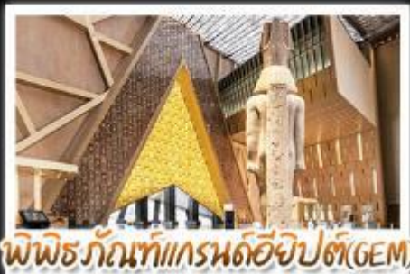
พิพิธภัณฑ์แกรนด์อียิปต์(GEM)

อารยธรรมลุ่มแม่น้ำไนล์ - พีระมิด - อเล็กซานเดรีย - เมมฟิส - ไคโร - โรงแรมระดับ 4 ดาว รวมค่าวีซ่า ทัศนะทะเลทราย - อาหารครบทุกมื้อ