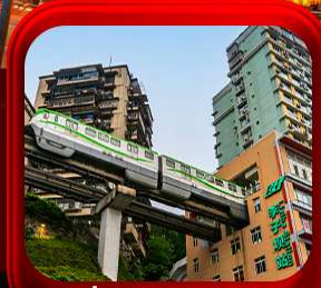
" นิ่งรถไฟคะสุดึก "

บินตรงลงฉงชิ่ง • อุ่หลง หลุมฟ้าสะพานสวรรค์ • ระเบียบแก้ว • อุทยานเขานางฟ้า หงหยาดัง • นิ่งรถไฟคะสุดึก • ศาลาประชาชน (ด้านนอก) • หลงหมินฮ่าว มรดกโลกผาหินแกะสลักต้าจู้ • วัดหลิวอัน • ตึกตะเกียบ • หมู่บ้านโบราณสี่ซีโงว่