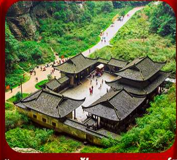
" อุทยานหลุมฟ้าสะพานสวรรค์ "

T2G-CKG27CZ Best of Chongqing... ฉงชิ่ง ต้าจู้ อุ่หลง อุทยานหลุมฟ้า เขานางฟ้า 6D 4N (CZ)