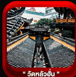
" วัดหลิวอัน "