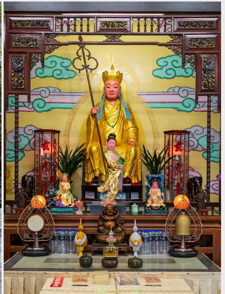
วัดพระถังซำจั๋ง (Xuanguang Temple)

นำท่านเดินทางสู่ กรุงไทเป (TAIPEI CITY) เมืองหลวงของไต้หวัน ศูนย์กลางทางการเมือง การปกครอง เศรษฐกิจ การค้า และวัฒนธรรมที่หลากหลาย มีประชากรประมาณ 2.6 ล้านคน กรุงไทเปถูกสร้างขึ้นตั้งแต่ปลายศตวรรษที่ 19 สมัยราชวงศ์ชิง มีอายุกว่า 130 ปีมาแล้ว แต่ยังคงรักษาไว้ซึ่งวัฒนธรรมอันเก่าแก่ อย่างเช่น โบราณสถาน ถนนสายเก่า และวัดวาอาราม ที่มีคุณค่าทางประวัติศาสตร์อยู่มากมาย ปัจจุบันไทเปเป็นหนึ่งในเมืองขนาดใหญ่ในทวีปเอเชียที่มีย่านการค้าที่มีชื่อเสียง มีอาหารนานาชาติ บรรยากาศยามค่ำคืนที่คึกคัก และระบบคมนาคมขนส่งสาธารณะที่มีประสิทธิภาพ รวมถึงเป็นที่ตั้งของตึก Taipei 101 ซึ่งเคยเป็นตึกที่สูงที่สุดในโลก และมีสถานที่ท่องเที่ยว ทั้งทางธรรมชาติและวัฒนธรรมอีกมากมาย (ใช้เวลาเดินทางประมาณ 3 ชั่วโมง 30 นาที)