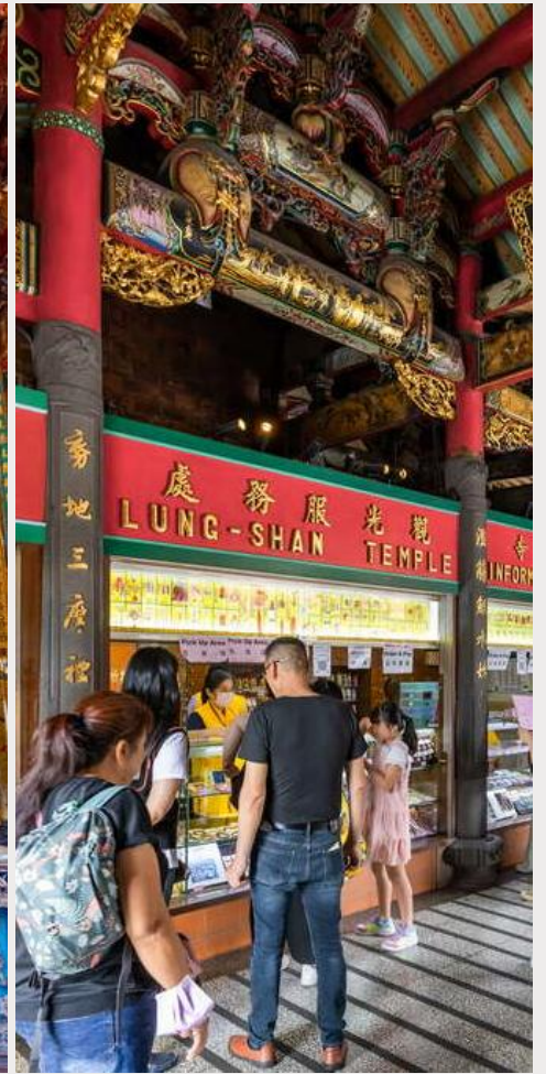
วัดหลงซาน (Longshan Temple)

กลางวัน บริการอาหารกลางวัน ณ ภัตตาคาร (เมนูพิเศษ บุฟเฟ่ต์ชาบู)