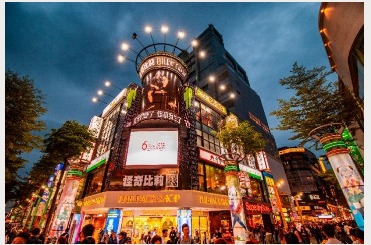
ตลาดกลางคืนซีเหมินติง (Ximending Night Market)

เย็น อิสระอาหารเย็นตามอัธยาศัย ณ ตลาดกลางคืนซีเหมินติง