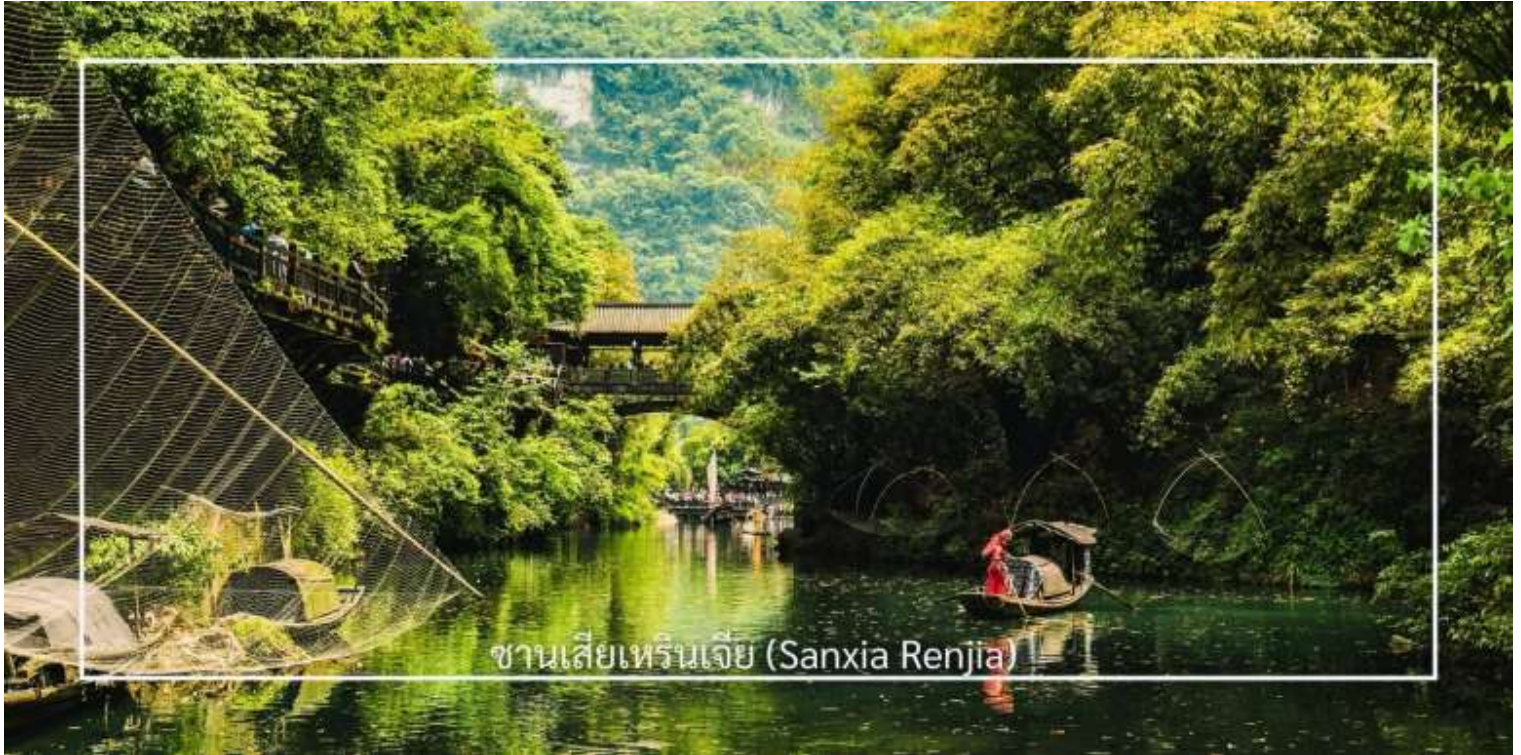
ซานเซียเหรินเจีย (Sanxia Renjia)

นำท่านสู่ หมู่บ้านซานเซียเหรินเจีย (Sanxia Renjia) (รวมล่องเรือ) สถานที่นี้เป็นที่รู้จักกันในชื่อ หมู่บ้านสามผา แหล่งท่องเที่ยวระดับ 5A ตั้งอยู่ในเขตหุบเขาสามผา ริมแม่น้ำแยงซีเกียง โดดเด่นด้วยทัศนียภาพทางธรรมชาติอันงดงามของภูเขา หินผา สายน้ำ และหุบเขาที่โอบล้อมกันอย่างกลมกลืน สถานที่แห่งนี้สะท้อนวิถีชีวิตดั้งเดิมของชาวลุ่มแม่น้ำแยงซีเกียง ผ่านสถาปัตยกรรมพื้นบ้าน วัฒนธรรม ประเพณี ที่ยังคงเอกลักษณ์ไว้อย่างครบถ้วน พร้อมให้ท่านได้ชมการแสดงเรื่องราวเกี่ยวกับวิถีชีวิตควบคู่กับสายน้ำ