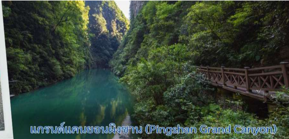
แกรนด์แคนยอนผิงซาน (Pingshan Grand Canyon)