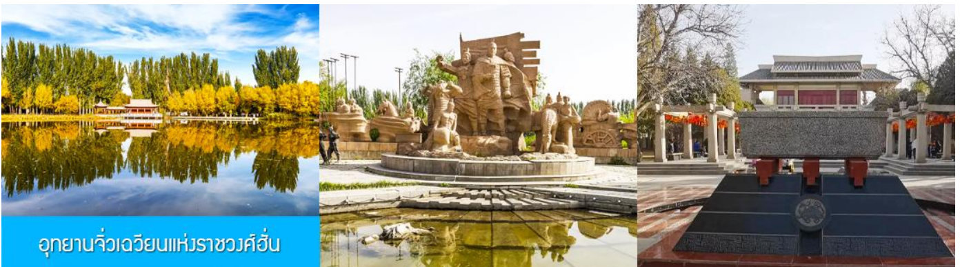
อุทยานจิวเจี๋ยนแห่งราชวงศ์ฮั่น

จากนั้นนำท่านเดินทางสู่เมืองจิวเจี๋ยน (ระยะทาง 50 กม. ใช้เวลาเดินทาง 1 ชั่วโมง)