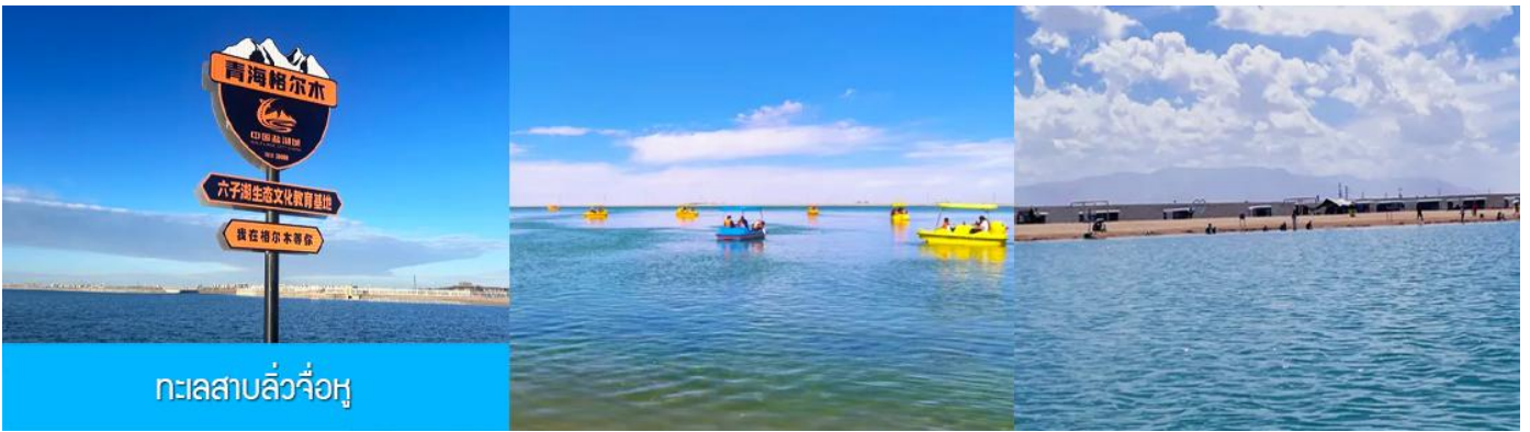
ทะเลสาบลั่วจื่อหู