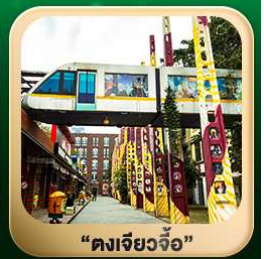
“ตงเจียวจื่อ”