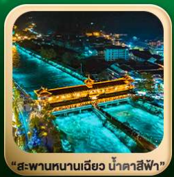
“สะพานหนานเฉียว น้ำคาสีฟ้า”

วันเดินทาง 4 วัน | 3 คืน มี.ค. - มี.ย. 2569