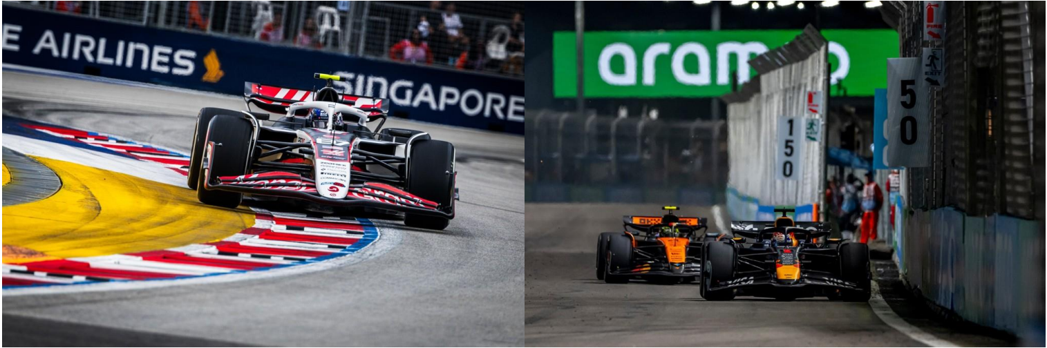
ชม รอบ SPRINT RACE + QUALIFYING

**เดินทางด้วยตนเอง เข้าร่วมงาน FORMULA 1 SINGAPORE GRAND PRIX 2026**