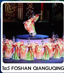
โชว์ FOSHAN QIANGUING