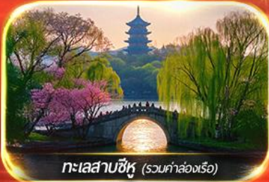
ทะเลสาบซีหู (รวมค่าล่องเรือ)