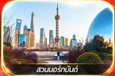
สวนนอร์มันด์