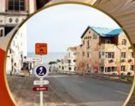
ถนนอ่าวจีปา