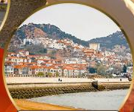
ซาจี้โข่ว