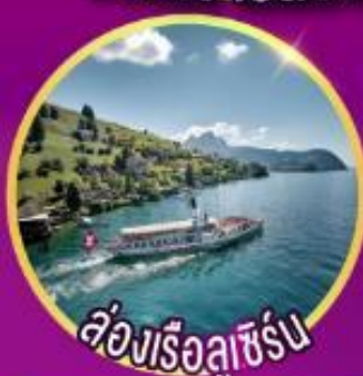
ล่องเรือลูเซิร์น