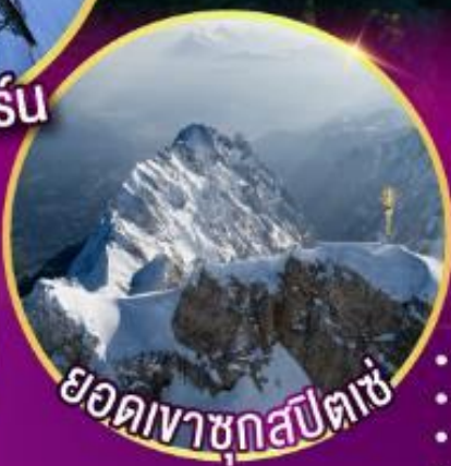
ยอดเขาชุกสปีตเซ