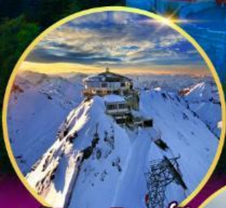
ยอดเขาซิลรอร์น