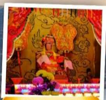
เจ้าแม่ทับทิม จอสเฮ้าส์เบย์