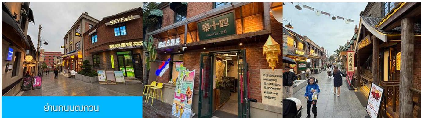
ย่านถนนตงกวน

นำท่านเที่ยวชม จัตุรัสชิงไห่ 星海广场 เป็นจัตุรัสขนาดใหญ่เป็นแลนด์มาร์คสำคัญของเมืองต้าเหลียน สร้างขึ้นเพื่อเฉลิมฉลองในโอกาสที่รัฐบาลอังกฤษคืนเกาะฮ่องกงในให้จีนในปี ค.ศ. 1997 ตั้งอยู่ชายฝั่งทะเลในเมืองต้าเหลียน เป็นจัตุรัสใจกลางเมืองที่ใหญ่ที่สุดในโลกและเป็นแลนด์มาร์คของเมืองต้าเหลียน รายล้อมด้วยตึกระฟ้าที่ทันสมัย ภายในมีบ่อน้ำพุดนตรี ลานหญ้าขนาดใหญ่ และลานกว้างสำหรับจัดกิจกรรมกลางแจ้ง อาทิ เทศกาลเบียร์นานาชาติ การแข่งขันวิ่งมาราธอน งานแฟชั่นนานาชาติเมืองต้าเหลียน ฯลฯ