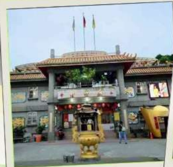
วัดจินซาน (โซคลาก)