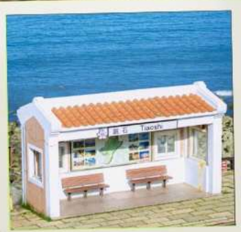
Tiaoshi Bus Station