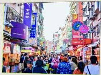
ถนนโบราณตื่นสู้ย