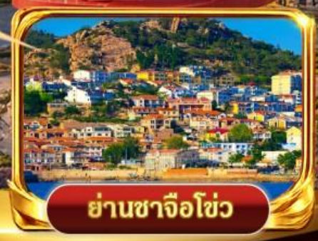
ย่านซาจื่อไช่