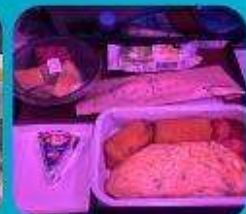
บริการอาหารร้อน ทั้งขาไป และ ขากลับ