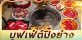
บุฟเฟ่ต์ปิ้งย่าง