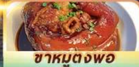
ชาหมตุงพอ