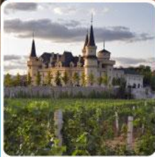
ไร่ไวน์ จุนยี่ เยียนโก