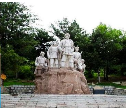
อนุสาวรีย์พิงหวง