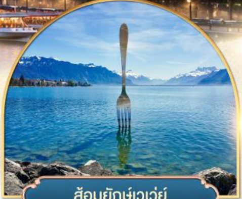
ส้อมยึกเขาวัว