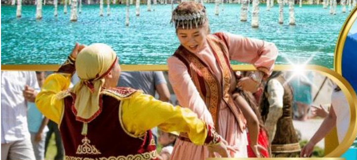
Huns Ethno Village