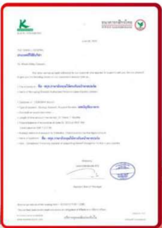
ตัวอย่าง Bank Guarantee ที่ผู้สมัครต้องยื่นกับสถานทูต