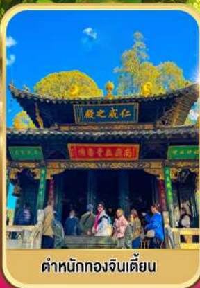
ตำหนักทองจินเตียน