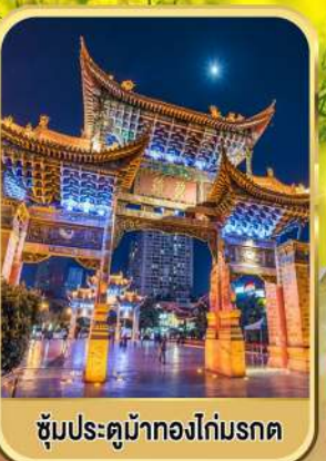
ซุ้มประตูม้าทองไถ่มรดก