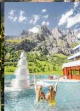
แช่สปปาลอยเทอรัมาด