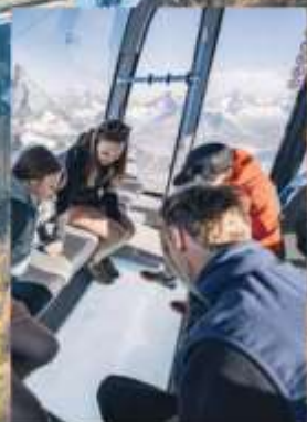
Matterhorn Glacier Paradise