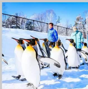
“PENGUIN ASAHİYAMA ZOO”