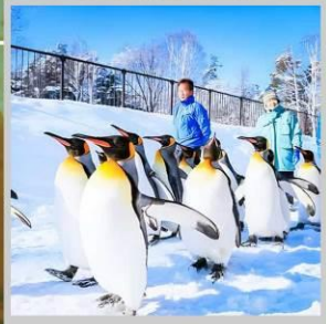
“PENGUIN ASAHIYAMA ZOO”