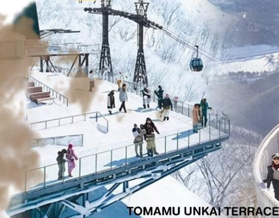
TOMAMU UNKAI TERRACE