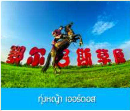
ทุ่งหญ้า เอร์โดส