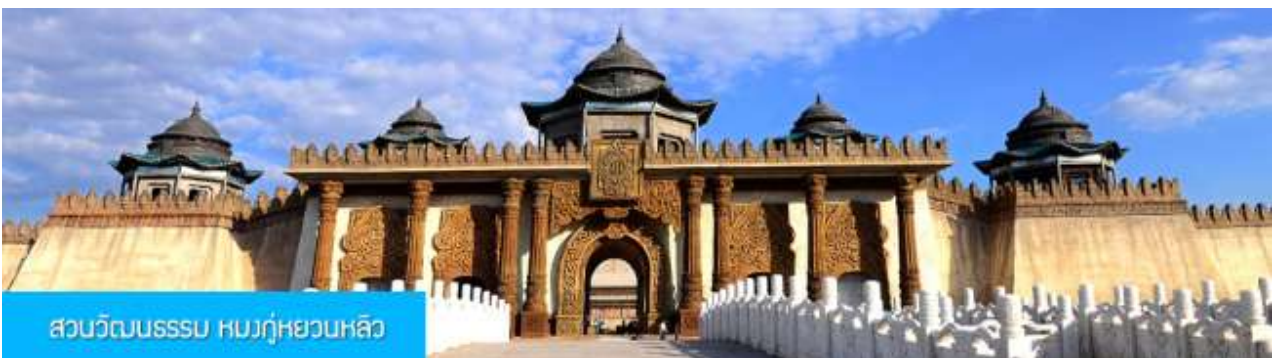
สวนวัฒนธรรม หมงกู่หยวนหลิว

หลังอาหารนำท่านเดินทางกลับเมืองเออร์ดอส (ระยะทาง 144 กม. ใช้เวลาเดินทางราว 2 ชั่วโมงเศษ)